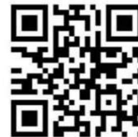
رمز بيانات لجنة المشاريع الكبرى