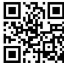
رمز صفحة FACEBOOK