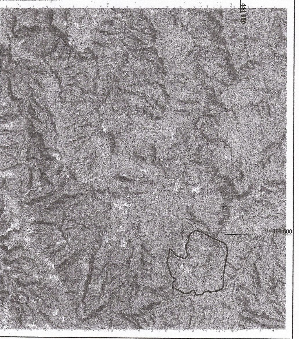
PLAN DE SITUATION EXTRAIT DE LA CARTE TOPOGRAPHIQUE DE ANSSIS Echelle 1/50000