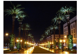
Le roi Mohammed VI avait lancé, le 12 mai 2014, le Programme intégré de développement urbain de la ville de Rabat 2014-2018, baptisé "Rabat ville lumière, capitale marocaine de la culture" qui s'inscrit dans la vision royale relative au développement du tissu urbain du Royaume, selon une démarche cohérente et équilibrée, en harmonie avec les aspirations des populations