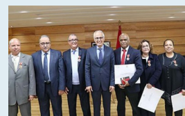
Des Wissams Royaux ont été remis, lundi à Rabat, à des fonctionnaires du ministère de l'Aménagement du territoire, de l'urbanisme, de l'habitat et de la politique de la ville.